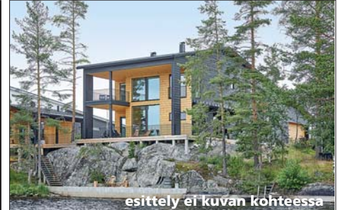
esittely ei kuvan kohteessa

Jalkarannan Monitoimitalo Jalossa toimivat Jalkarannan koulu, päiväkotit, alle kouluikäisten kerhotoiminta, kirjasto, oppilas- ja kouluterveydenhuoltopalvelut sekä Päijät-Hämeen Ateriapalvelut Oy:n palvelukeittiö. Liikuntatilat on mitoitettu koulun ja päiväkodin lisäksi palvelemaan myös alueen ja kaupungin asukkaiden käyttöä. Jalkarannan koulussa 1-6 luokkalaista on 325. Jalkarannan päiväkodissa toimii kymmenen lapsiryhmää, lapsia yhteensä 160.