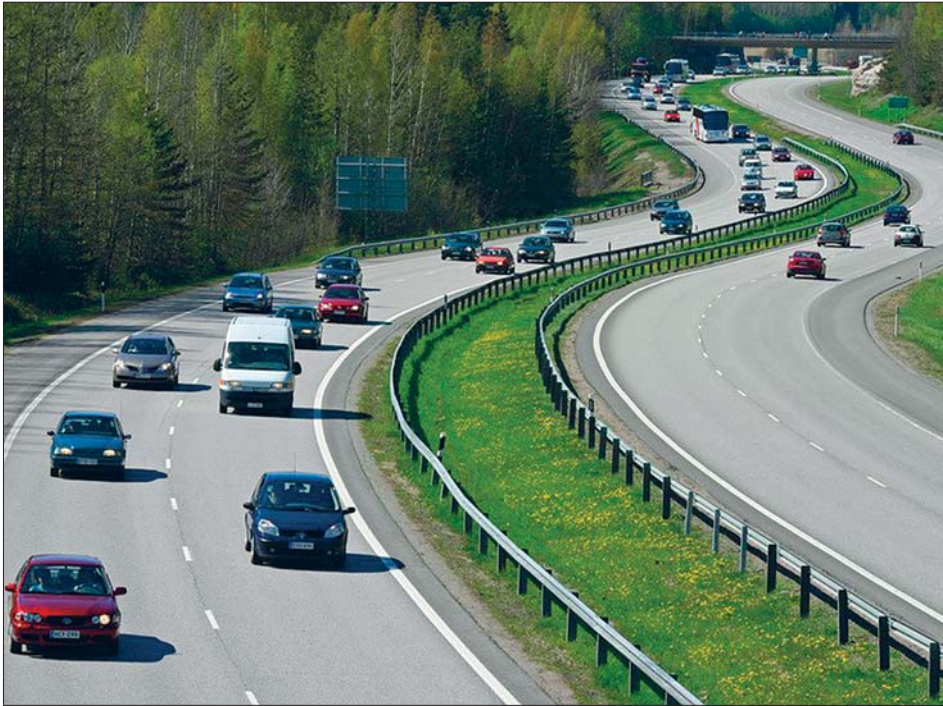
Turvallisuus ensin - moottoritielläkin.