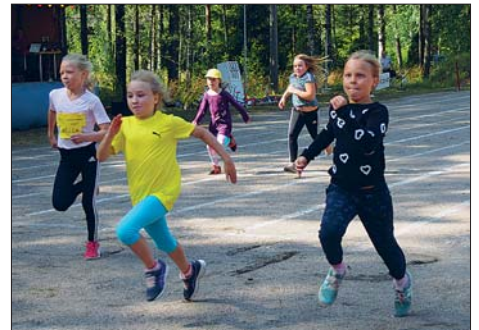
Viime vuoden tapahtuman tyttöjen juoksu.