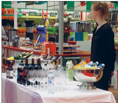
Tarjolla oli erilaisia tuotteita ja myöskin tarjoi pelasi moitteettomasti.