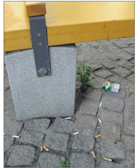
Uusi upea penkki Mariankadulla. Ilkivallantekijältä on mennyt aikaa ja tupakkia rikkomista miettiessä. Tupakit loppuivat ja henkilö lähti etsimään helpompaa kohdetta.

Päihdehenkilöt ovat enimmäkseen harmittomia, mutta joillakuilla on taipumus häiritä kanssaihmisia huutelemalla tai vaatimalla rahaa.