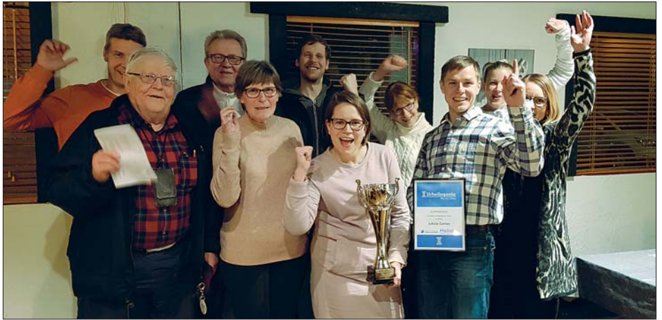
Talkooporukkaa pystin kanssa.

CDP:n lista: https://www.cdp.net/en/cities/cities-scores