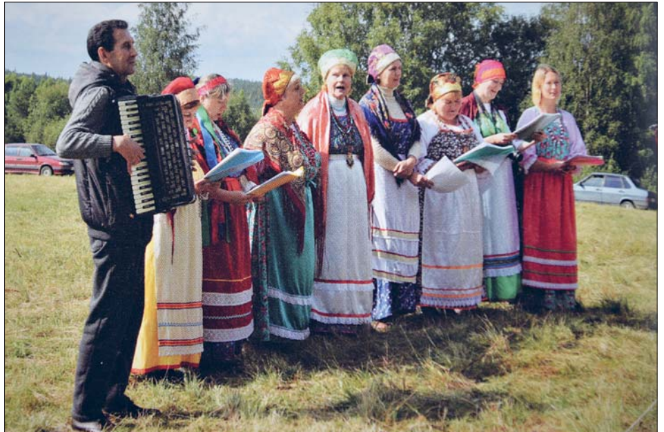
Latvajärven kyläjuhlan laulajia kesällä 2019.