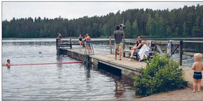
Vähä-Tiilijärvi on suosittu virkistysjärvi. Uimarannan vilskettä viime elokuussa.

Järven pohja on pehmeä ja eloperäinen. Järven keskeisessä syvänteessä havai-