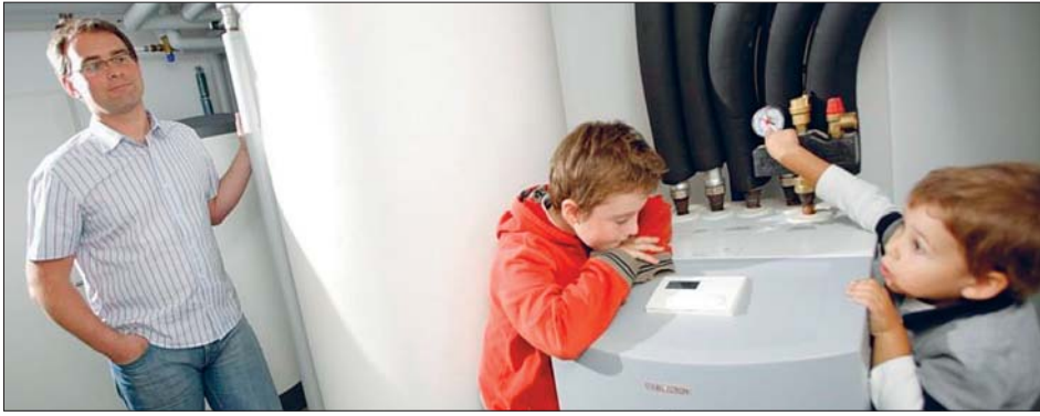
Uusitut pientalojen lämmitysjärjestelmät ovat helppohoitoisia ja säästävät käyttökustannuksissa.