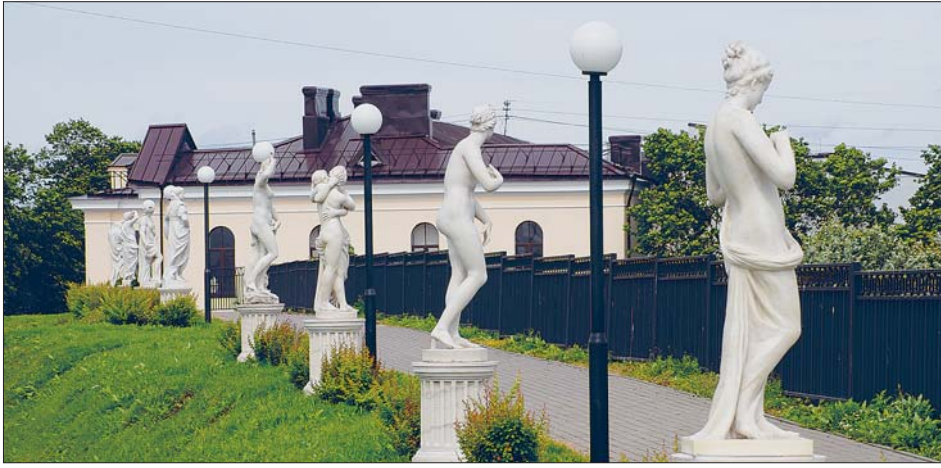
Kuvapatsaiden kuja Viipurin taidemuseon sivustalla.