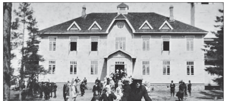
Vahvialan kunnantalo oli monitoimitalo, jossa toimi kunnanvirasto, kirkkosali ja seurakunnan toimisto.

Kuvien kerääminen ja taltiointi kuitenkin jatkuu. Ennen sotia ja sotien aikana otettujen kuvien jälkeen Vahviala-seura aloittaa evakokojan kuvien taltioinnin.