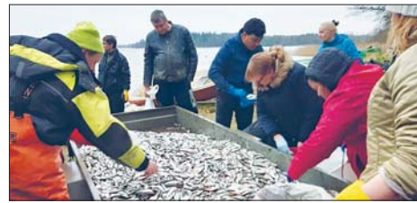
Hoitokalastussaaliin Kymijärven Lahden pään nostopaikalta Karistosta noudettiin vilkkaasti kalaa.

Kymijärvi on ekologiselta tilaltaan välttävä ja se on