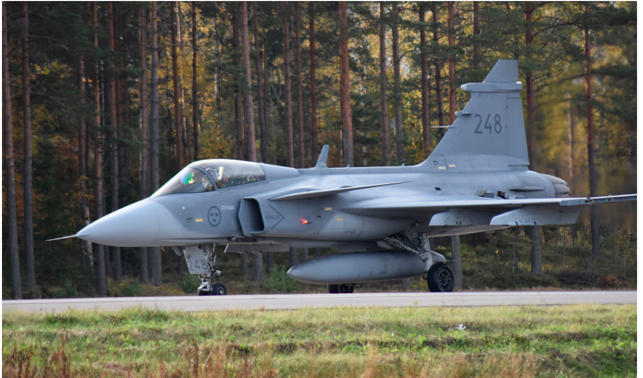
Ruotsalainen Saab JAS Gripen 29 on yksi Suomelle tarjotuista hävittäjistä.