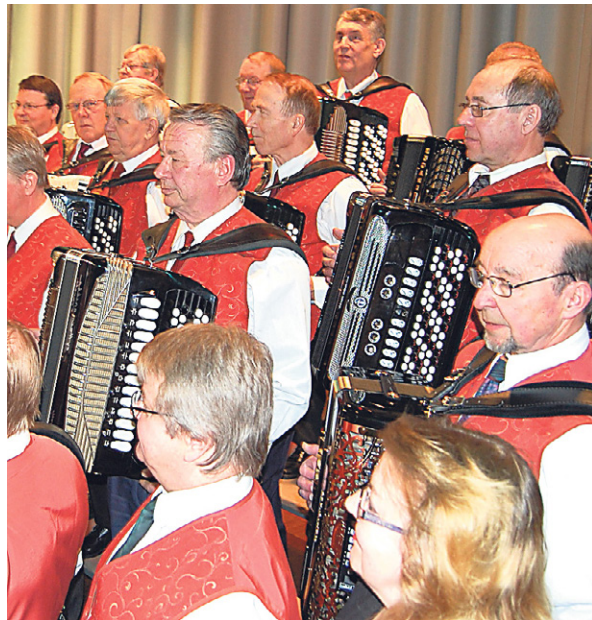
Harmonikat haluavat nuoria soittajia joukkoonsa, lähes kaikenlaisten instrumenttien osaajat ovat tervetulleita.

Yleisö konserteissa on pääsääntöisesti ollut aikuista väkeä, mutta viime vuosien aikana on ollut yleisön joukossakin havaittavissa jonkinlaista ”sukupolven-