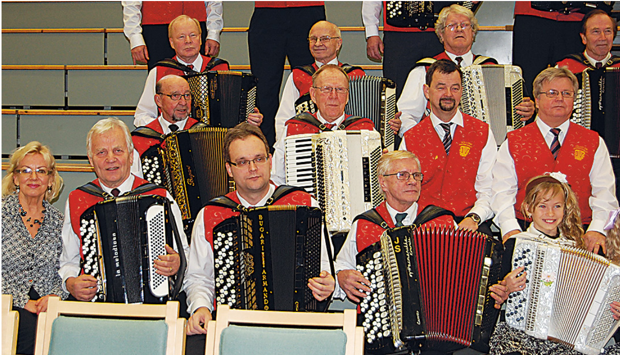
Hollolan Harmonikkojen suurkonsertin solistit ovat löytyneet pääosin omasta joukosta.

Viime vuonna jouduttiin Hollolan Harmonikkojen suurkonsertti perumaan koronavirustilanteen vuoksi ja myös tämän vuoden marraskuun konsertti on vaakalaudalla. Peruuntumisuhkasta huolimatta harmonikat harjoittelevat konserttia varten. Marraskuisen konsertin ohjelmisto selviää syksyn aikana.