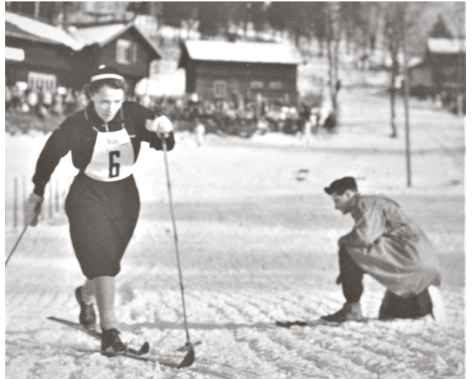
Lydia Wideman voitti 10 kilometrin kilpailun Oslon olympiakisissa 1952.

Rossi osallistui myös valmentamiseen. Sauvakävely, rinnejuoksu ja pitkät lenkit kuuluivat ohjelmaan. Rossin perhe joutui koville, kun Rossin koti muistutti välillä