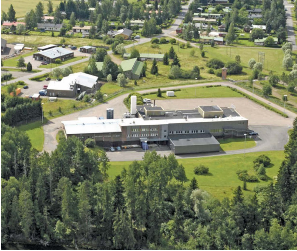
Maitotuotteista kaurajuomiin siirtynyt Kaslink-yhtiö aloitti Elimäen Korian keskustassa.

Veljesten yhteistyön rakoilu johti yhtiökauppaan