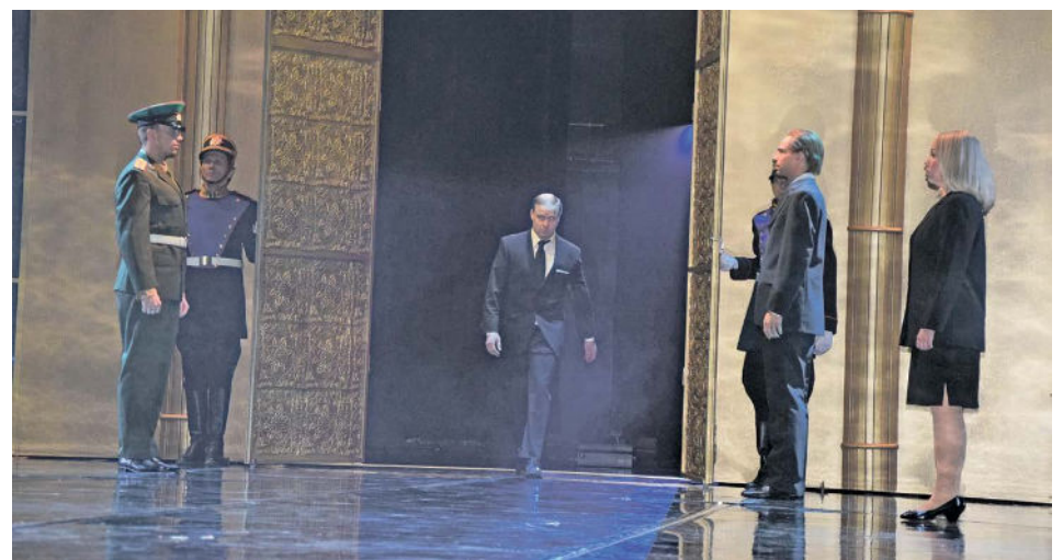
Vladimir Putin astelee Lahden kaupunginteatterin lavalle samanlaisista korskeista ovista kuin television uutisissa.

Vuoden 2006 marraskuussa Aleksandr Litvinenko sai