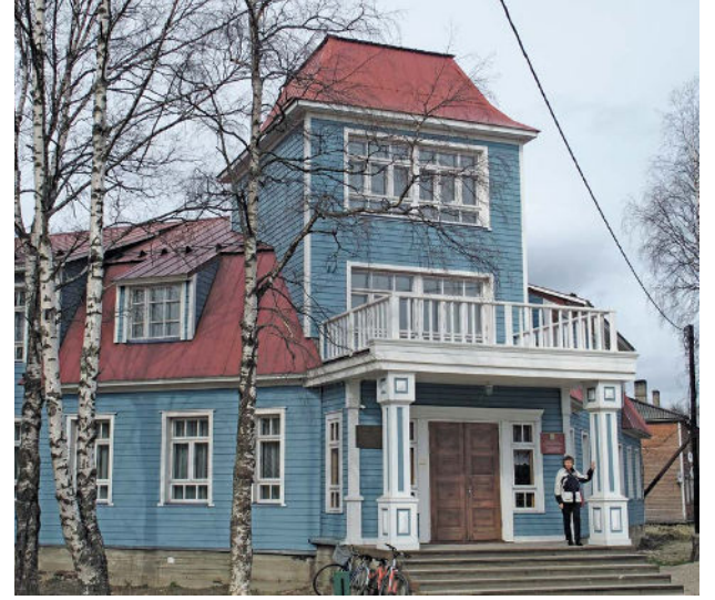
Uhtuan nykyinen hallinto- ja kulttuurirakennus.