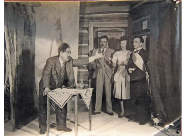
Särkelä itte -näytelmä Lahden kaupunginteatterissa vuonna 1944.

Syksyn 2023 esitysten myynti alkoi keskiviikkona 13. maaliskuuta. Ensi-illat alkavat porrastetusti syyskuun alusta lokakuun puoliväliin ulottuvalla jaksotuksella.