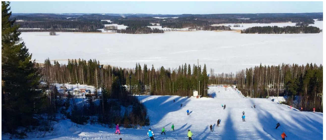
Messilään tai Tiirismaalle on luotavissa kansainväliset mitat täyttävä lumilautailukeskus.

Tarvitavat investoinnit ovat suhteellisen vähäiset