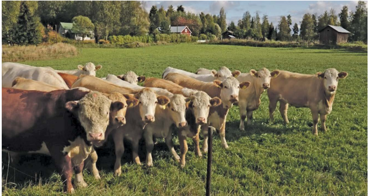
Karjalan pääluvun kasvattaminen on lisännyt maatilojen työtaakkaa, vaikka automaatio on tullut työn avuksi.