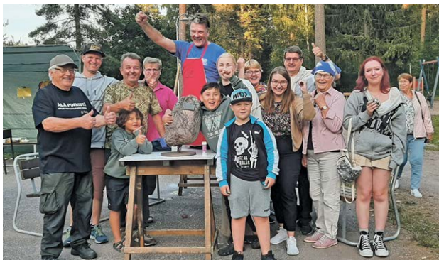
Voittajajoukkue Hiidenkiven Hirmut

- Tänä vuonna voitto ratkesi juuri maastossa kuntorasteilla tehtyyn tiimityöhön.