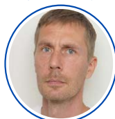
Roope Hanén Kirjanpito