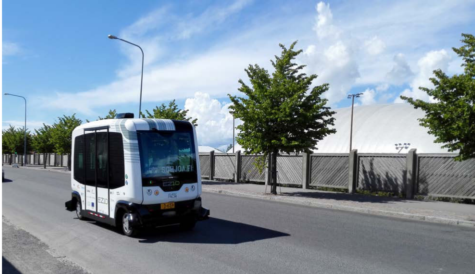
Robottiautoja aiotaan kokeilla liikennekäytössä Lahdessa. Talviset kelit ovat niille vielä vaikea kokemus.

Konetekniikkaa pystyy myös harhauttamaan