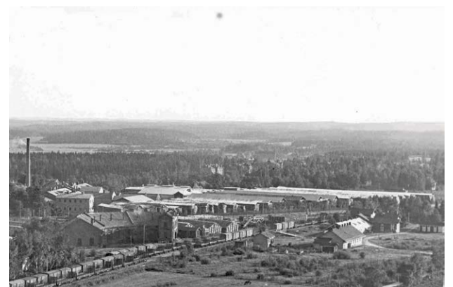
Tornatorin rullatehdas sorvasi jojoja lyhyen pelivillityksen ajan.

maailmalla. Myöhemmin 1960-luvulla, jojosta tehtiin mainosväline, jossa oli mainostettavan tuotteen nimi, kuten Coca Cola.