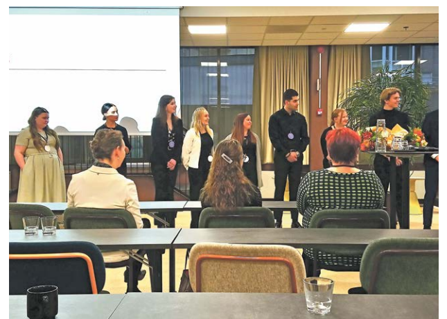
Tarkastuskertomusten palkittujen valintaan osallistui Tampereen yliopiston julkisen talouden opiskelijoista muodostettu raati.

Kilpailussa julkistetaan vain voittajat, mutta saatujen taustatietojen mukaan Lahti oli aivan kärkipaikoilla, kun valintaraati teki lopullisen voittajan valintaa. Lahden sarjassa voittaja oli siis Seinäjoen kaupungin tarkastuslautakunnan kertomus. Lahden tarkastuslautakunta tekee parhaillaan syksyn tarkastuskierrosta kaupungin eri toimialoilla. Varsinainen tarkastuskertomuksen laati-