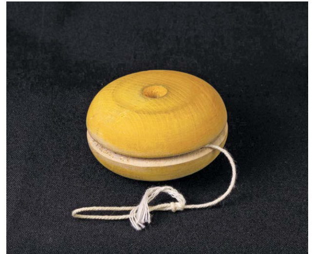
Alkuperäinen jojo sorvattiin kahdesta puukiekosta.

Lahden Tornatorin tehdas sai pian kotimaisen kilpailijan. Huonekalutehdas Sorvimo Turusta hankki kaksi uutta sorvia, joiden avulla se pystyi valmistamaan jopa kymmeniä tuhansia jojo-kiekkoja päivässä. Sen markkinoiden kohteena olivat erityisesti Iso-Britannia ja Ranska. Jojo-innostui kuitenkin päättyi pääosin joulukuun 1932. Sen jälkeen se hiipui nopeasti sekä Suomessa, että