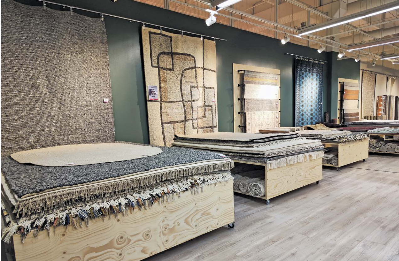
Lahten liikkeestä löytyy kattava valikoima mattoja jokaiseen kotiin.