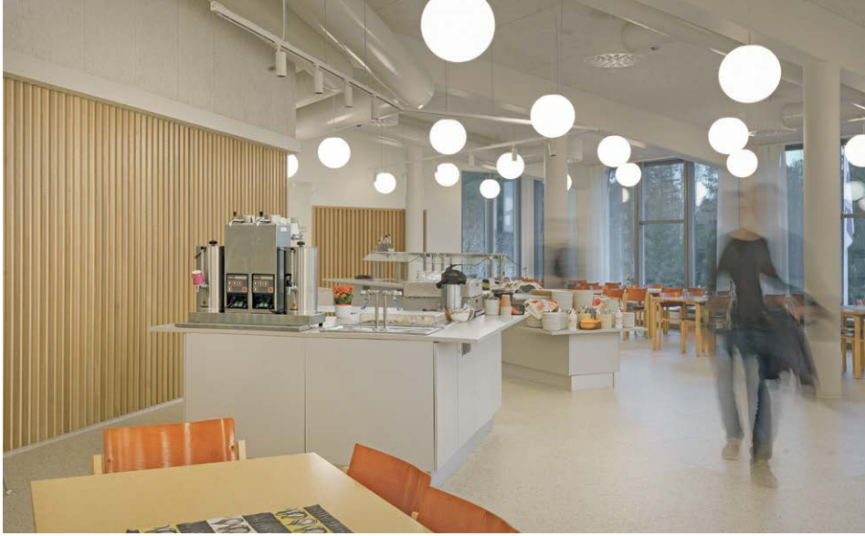
Tammiviilu seinillä on uutta. Se tuo toivottua pehmeyttä ja lämpöä kivitaloon.