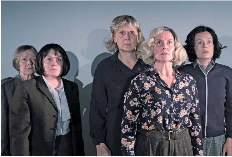
Viiden naisen roolit näytelmässä ovat vaativia suorituksia.