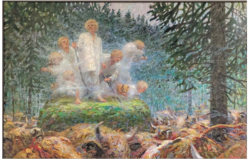
Seitsemän veljestä Hiidenkivellä Arto Pennasen maalauksessa.

Jos koira on ollut jäisessä vedessä pitkään, sen yleisvointi huononee tai ruumiinlämpö on alle 37 astetta, ota yhteyttä eläinlääkäriin.