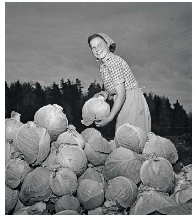
Hollolan Kutajoella saatiin satona myös kookkaita kaaleja vuonna 1953.