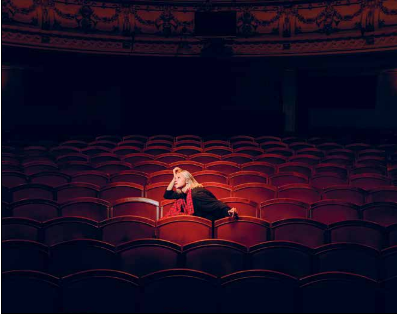
Näyttämöesitys kertoo ukrainalaisten naisten henkilökohtaisista kokemuksista.