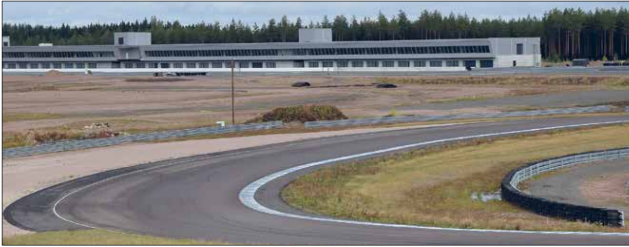
KymiRingin varikkorakennus on viimeistelyä ja kalustoa vailla.