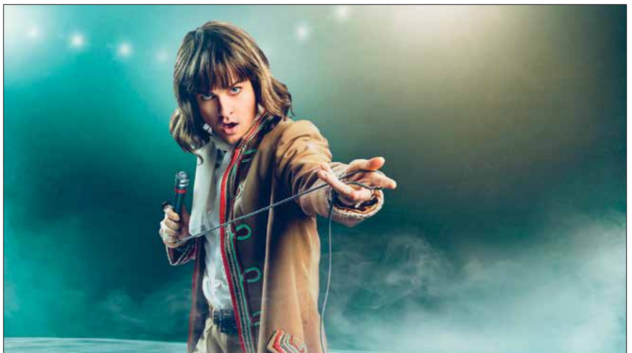
Kirka-musikaali kuvaa yhden kuuluisan Babitzinin laulajaperheen jäsenen elämää.

s-posti: niina.ojansivu@lahdenseudunuutiset.com