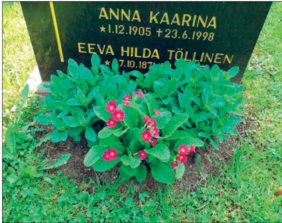
Perennoihin kuuluvat maksaruohot ja esikot viihtyvät auringon lämmittämällä istutuspaikoilla.

- Kesäkukkien jatkuva runsas kukinta vaatii säännöllistä kuituneiden kukkien poistoa ja paljon kastelua - Perennoissa harvoin tuholaisia, joten taimia joutuu vaihtamaan vähemmän