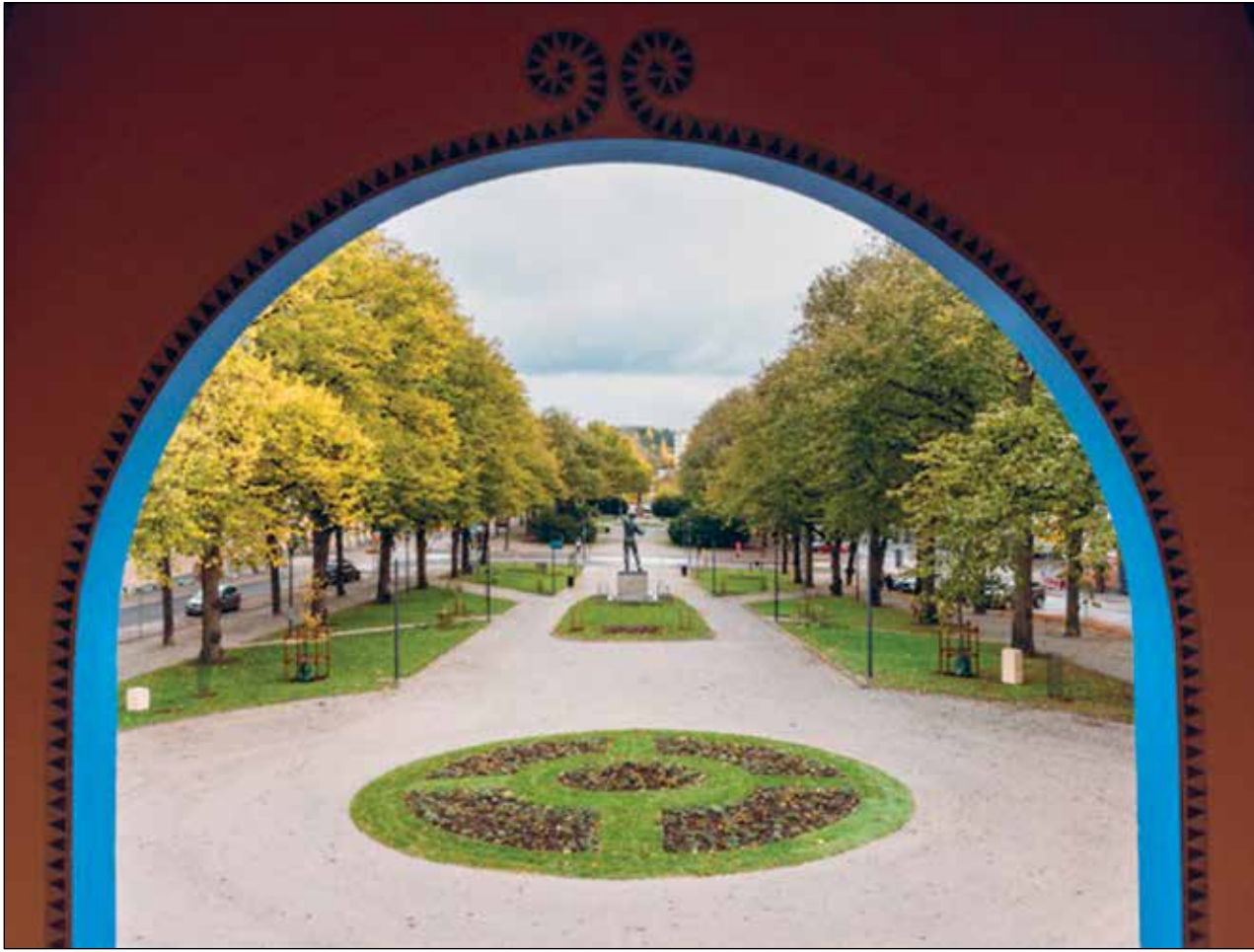
Näkymä kaupungintalon rappusilta puistoon