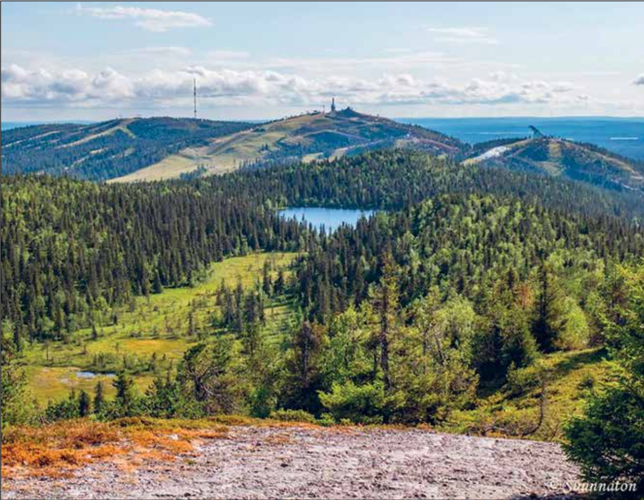
Rukan Valtavaaran huipulta aukeavaa maisemaa.