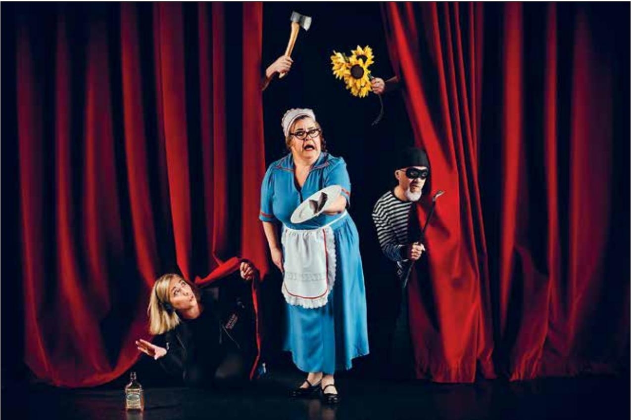
Kaaos-farssi avaa vauhdikkaasti Kouvolan teatterin syksyn.

s-posti: niina.ojansivu@lahdenseudunuutiset.com