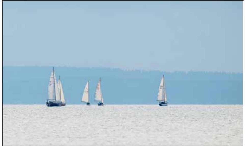
Purjeveneet Päijänteellä.

Haluatko jakaa oman lempi kuvasi? Lähetä se meille osoitteeseen toimitus@lahdenseudunuutiset.com