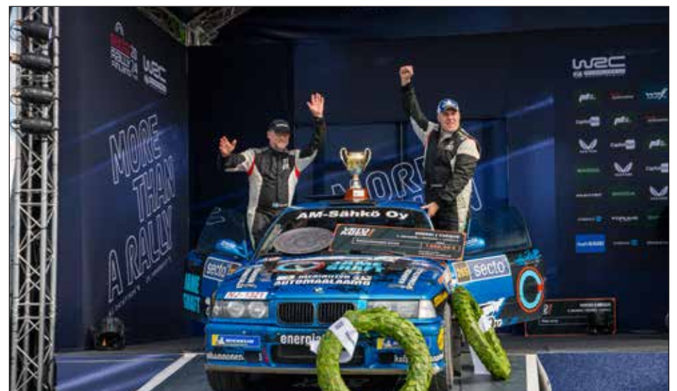
Teksti Jani Seppälä