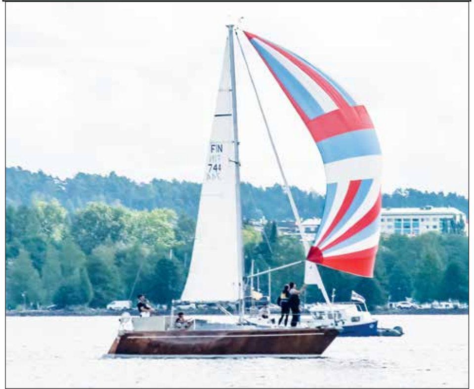
Lahden Regatta.

Haluatko jakaa oman lempi kuvasi? Lähetä se meille osoitteeseen toimitus@lahdenseudunuutiset.com