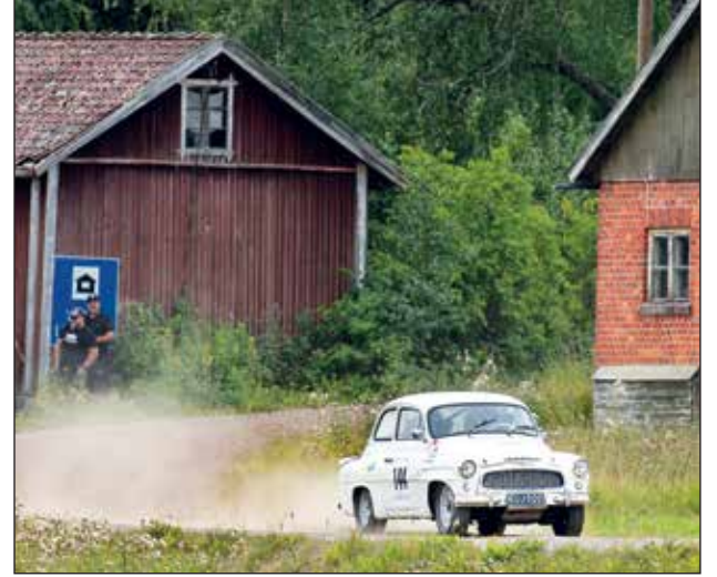
Škoda Octavia Super.