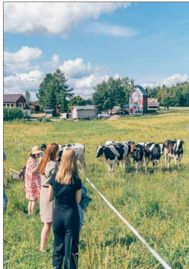
Niipalan tila, Hollola.