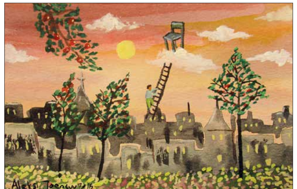
Jos kärsii yksinäisyydestä, kannattaa miettiä, ovatko sen helpottamisen konstit kohdallaan. Aleksis Joensuun akvarelli.