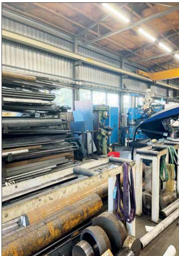
Kunnaksen Metalli Oy.