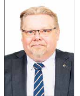
Kansanedustaja Jari Ronkainen

tukaan, olemme silti alttiita muun muassa Venäjän vihamieliselle vaikuttamiselle. Suomalaisten on siis syytä pysyä valppaana; emme voi vain tuudittautua siihen, että täällä ei mitään tapahdu, vaan uusiin turvallisuustilanteisiin on kyettävä reagoimaan riittävällä nopeudella ja painokkuudella.