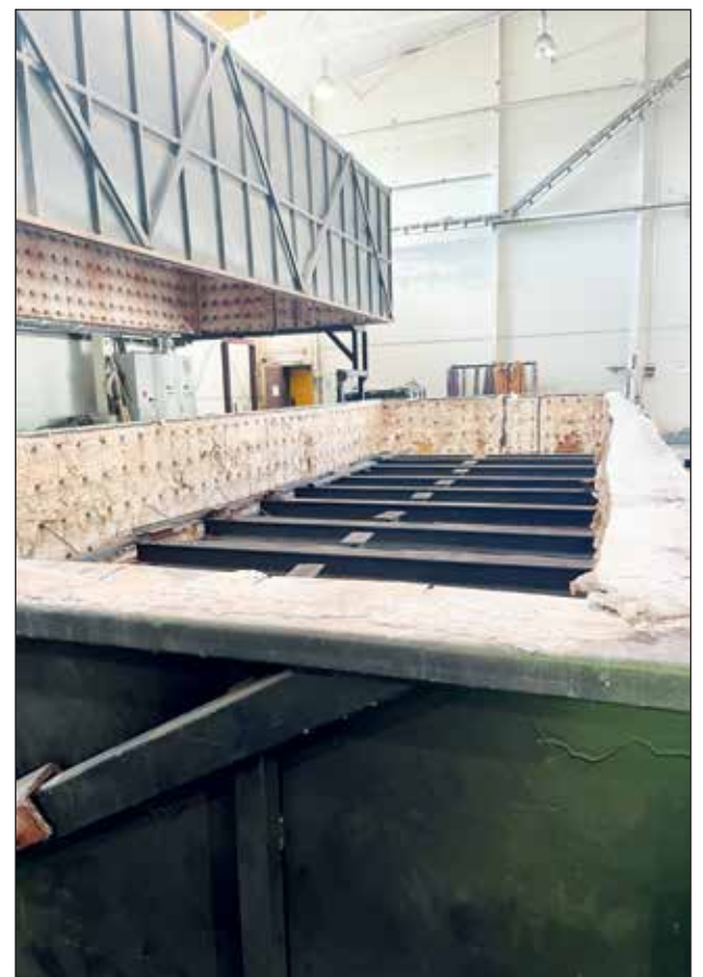
Heatmaster Oy iso lämmitysuuni.