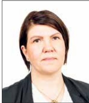
Mira Nieminen Kansanedustaja

Opettajat joutuvat tasapainoilemaan pedagogisten velvoitteidensa, kasvatuksellisten haasteiden sekä vanhempien välillä. On kaikkien yhteinen asia, että kohtamme ongelmia ratkaisukeskeisesti ja puutumme epäasiallisuuteen varhain. Vanhempien täytyy ottaa oma paikkansa takaisin lastensa elämässä. Aito läsnäolo ja sitoutuminen lapsen kasvuun ja kehitykseen ovat tärkeitä ja vain sillä voimme selittää nykyisiä ongelmia, myös lasten kokemaa masennusta. Lapsi kaipaa rajoja, rakkautta ja johdonmukaisuutta – elementtejä, joita ei voi ulkoistaa.