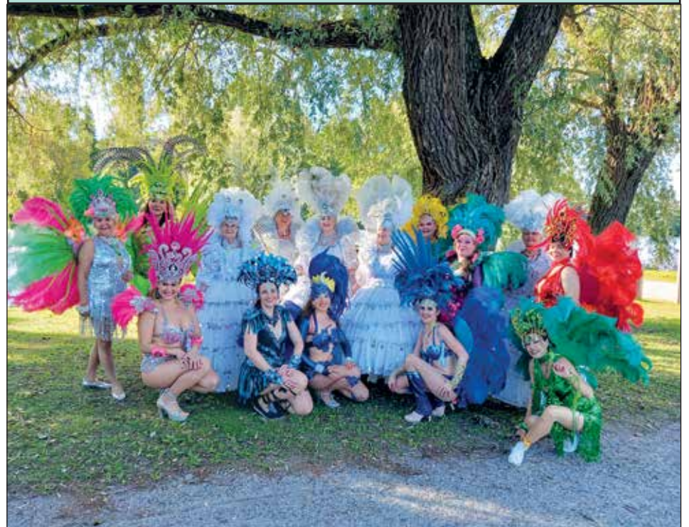
Lahden Samba Maracana Pikku-Vesijärven puistossa esityksen jälkeen 21.09.2024

Lähetä meille lempikuvasi! toimitus@lahdenseudunuutiset.com