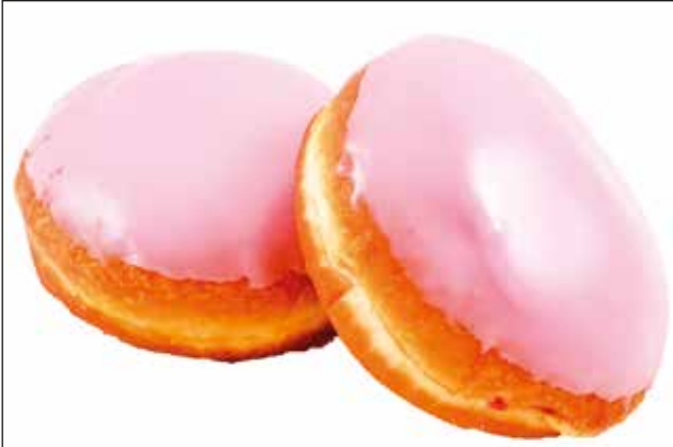
Piispanmunkki ja berliininmunkki on tavallisesti päällystetty vaaleanpunaiseksi.