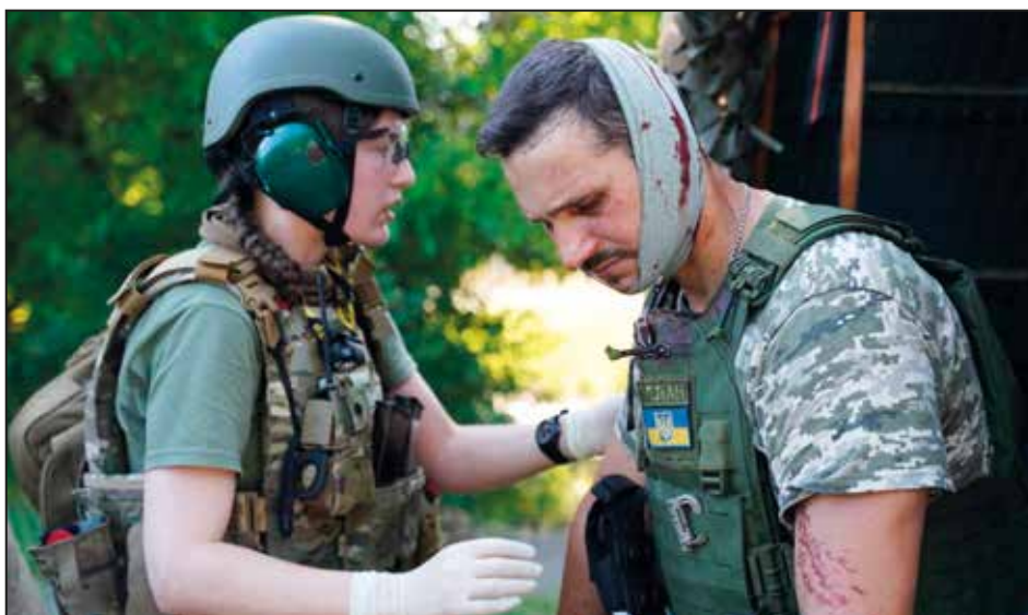
Haavoittunutta sotilaspastoria autetaan Zaporizzijan läänissä.