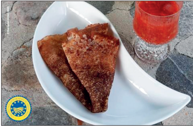
Muurinpohjalettu on saanut maakunnallisen EU-merkinnän.

Yläsavolaisen muurinpohjaletun maantieteellisen alueen muodostavat Ylä-Savon kunnat: Iisalmi, Keitele, Kiuruvesi, Lapinlahti, Pieplavesi, Sonkajärvi ja Vierevä. EU-merkintää hakivat ProAgria Itä-Suomen maa- ja kotitalousnaiset.