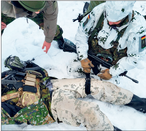
Päijät-Hämeen paikalliskomppanioiden harjoitustilanne.