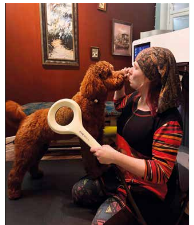
kuvassa hoidetaan Magnetolith (EMTT) hoitolaiteella. Hoito soveltuu hyvin myös koiralle nivelrikkokipujen lievitykseen, luummurtumien luutumisen tehostamiseen, lihasvähädyksen tai jännevammojen tehostettuun hoitoon.