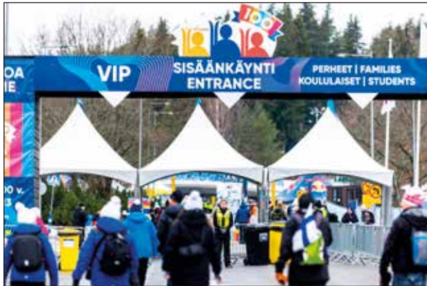
Salpausselän kisat vuonna 2023.