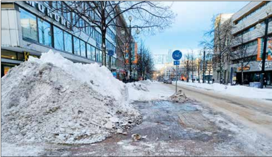
Väliaikaisesti varastoitua lunta lahden keskustassa tammikuussa 2024.

Hankkeessa on lisäksi kehitetty menetelmä paikkatietopohjaiseen lumen lähisiirtopaikkojen kartoittamiseen. Käsittelemällä katualueiden laadullista riskiä tai tulvahaittoja aiheuttamattomat auraukset paikallisesti antamalla niiden sulaa kasvillisuuspeitteisillä alueilla mahdollisimman lähellä syntypaikkoja voidaan laadullisten hulevesirisken hallinnan ja pohjaveden muodostumisen edistämisen lisäksi saavuttaa merkittäviä kustannussäästöjä vähentyneen lumen kuljetustarpeen seurauksena.