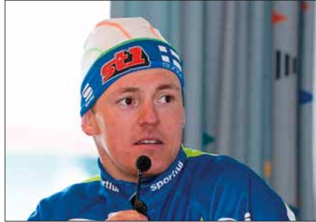
Sami Jauhojärvi lähti Lapista kisaladuille.