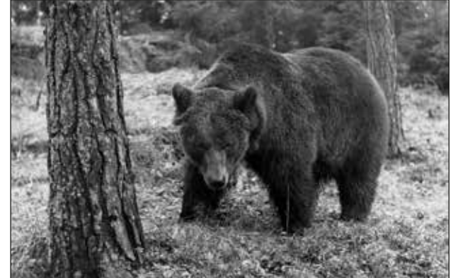
Pipsa-karhu filmaustauolla.

Punainen viiva -elokuvan kuvauksiin tarvittiin elävä karhu. Se saatiin Sirkus Finlandiasta. Karhun nimi