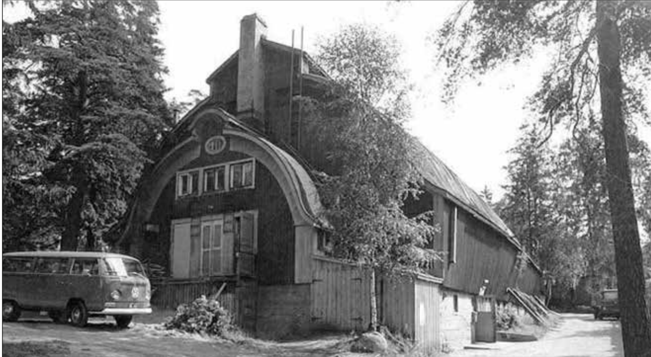
Kulosaaren vanha tennishalli toimi elokuvastudiona.