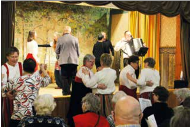
Viime syksyn iltamat Asikkalasta Suovolan nuorisoseurantalolta.

Lisätiedot ja lippujen ennakkovarausohjeet: www.lahdenharrastajateatteri.com