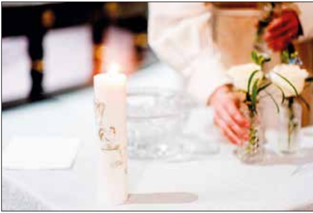
Yhteiseen kastejuhlaan kutsutaan kaikkia 0–15-vuotiaita kastamattomia lahtelaisia.

Yhteiseen kastejuhlaan ilmoittaudutaan 8.5. mennessä seurakuntatoimistoon, p. 044 719 4629 / lahti.seurakuntatoimisto@evl.fi Sen jälkeen pappi on yhteydessä kasteperheeseen ja kertoo lisää kastetoimituksesta ja itse tilaisuudesta.