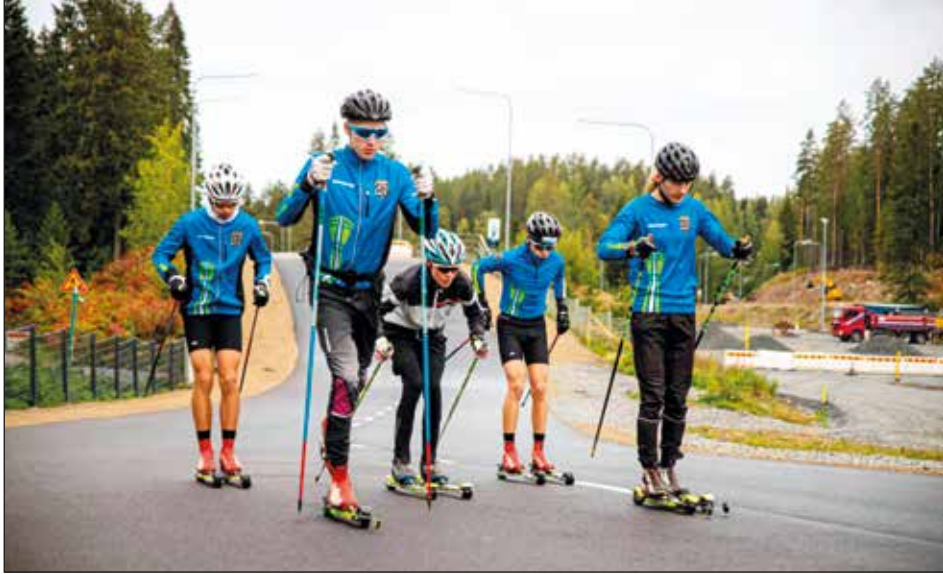
Lahteen kaavaillaan rullahiihtorataa. Hollola ja Päijät-Hämeen liitto eivät ole suunnitelmassa näkyvästi mukana ja osapuolina. Kuva Puijolta.