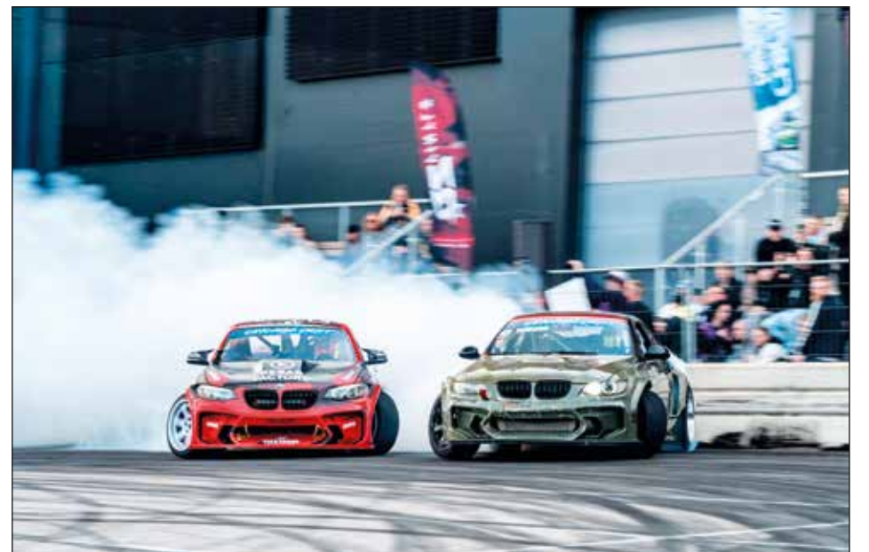
Meriloo edellä, Krogeris seuraa.

Chicago Drift Lehdistöpäällikkö Jani Seppälä