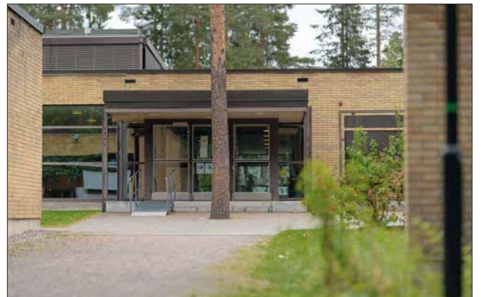
Salpausselän kirkko.

Salpausselän kirkon korvaavasta uudisrakennuksesta ei ole toistaiseksi tehty päätöstä.